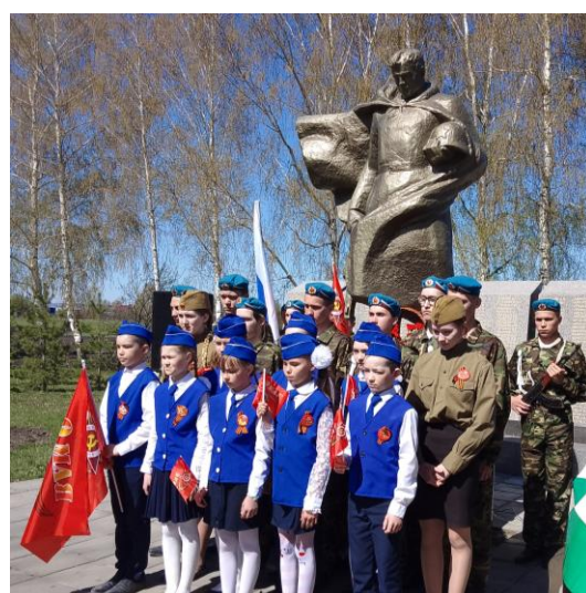
Акция «Я помню! Я горжусь!»