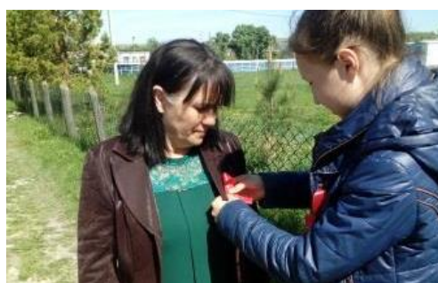
Акция «Георгиевская ленточка»