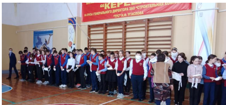
После учебной тренировки по эвакуации